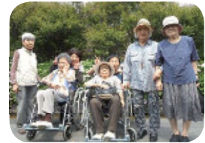
アジサイも綺麗に咲いていました