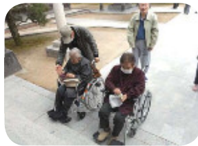
元気で過ごせますように☆