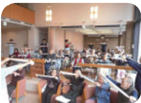
タオルを使用しての体操

理学療法士による運動を運営懇談会後に行いました。 筋力の保持に効果的な運動など無理をしない程度に指導していただきました。元気に生活していただけるよう職員一同支援していきたいと思ひます。