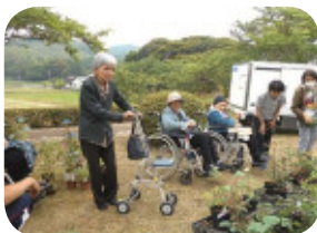
花の苗を鑑賞したり、美術館に行って楽しんできました♪