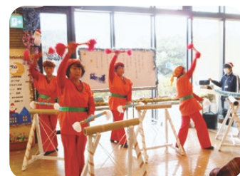
さくら会による銭太鼓披露。入居者さんも手拍子で参加☆