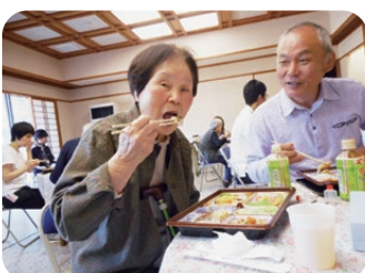
家族と一緒に昼食会。一緒に食べると会話も弾むね♪