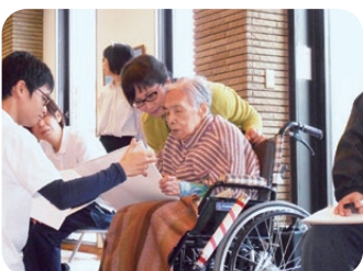
家族参加型のゲームも大いに盛り上がりました!!