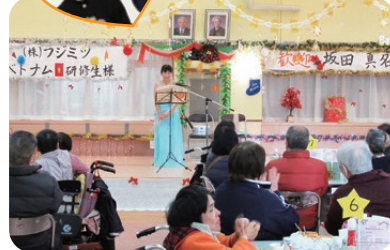
心に響く優しい音色に聞き入るみなさん