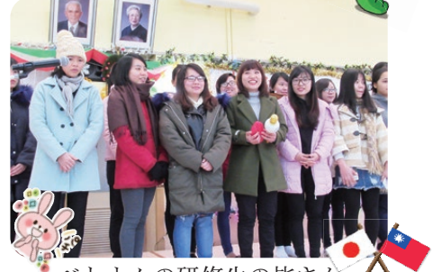
ベトナムの研修生の皆さん お国の歌を披露して下さいました