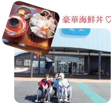
センザキッチンにて 豪華海鮮丼♡ 記念撮影