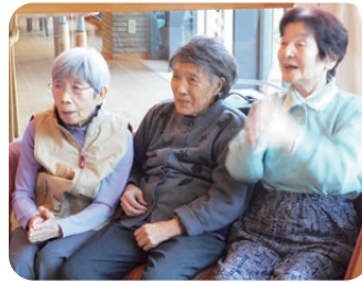
掛け声とともに手拍子。「はっは、ほっほ」