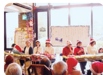
職員によるクリスマスソングメドレー♪