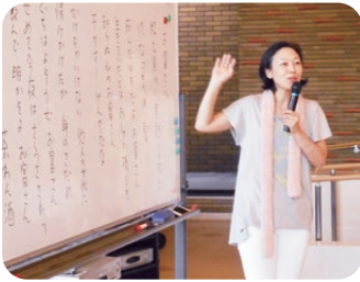
先生の指導の下、笑いヨガ初挑戦!!