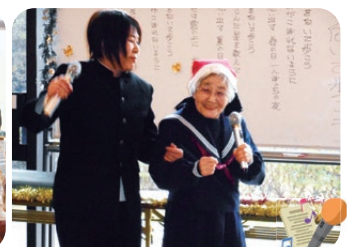
各階対抗カラオケ大会 高校3年生の2人です (@△@)