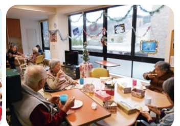
クリスマスと言えば… ケーキ食べなきゃね