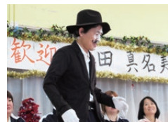
新人職員もよく頑張りました