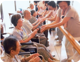
職員と手を繋いで… 照れ笑い▽