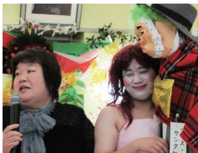
隠された中堅職員の才能に脱帽