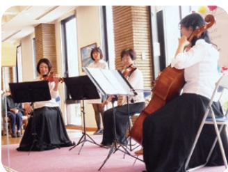
秋弦楽オーケストラによる演奏。綺麗な音色でした。