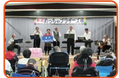
長門めっちゃブラザーズ様