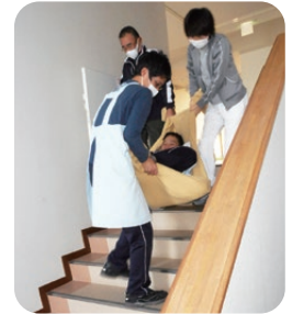
毛布を担架代わりに負傷者を避難