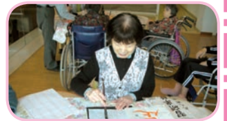
先生の指導が入り・・・しっかりと書かれています