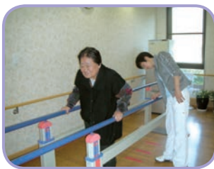
平行棒を使用して歩行訓練

4月に理学療法士を採用し、週1~2回機能訓練を行っています。入居者さんのそれぞれ身体の状態に合わせた訓練メニューに沿って先生の指導の下、自主的に訓練に取り組んでいらっしゃいます。